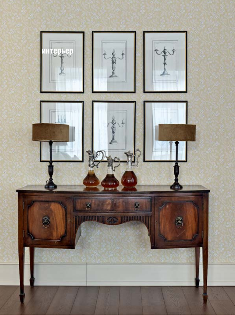
Фрагмент спальни. Консоль и декор, салон « Цветы и птицы ». Светильники, Don Maison