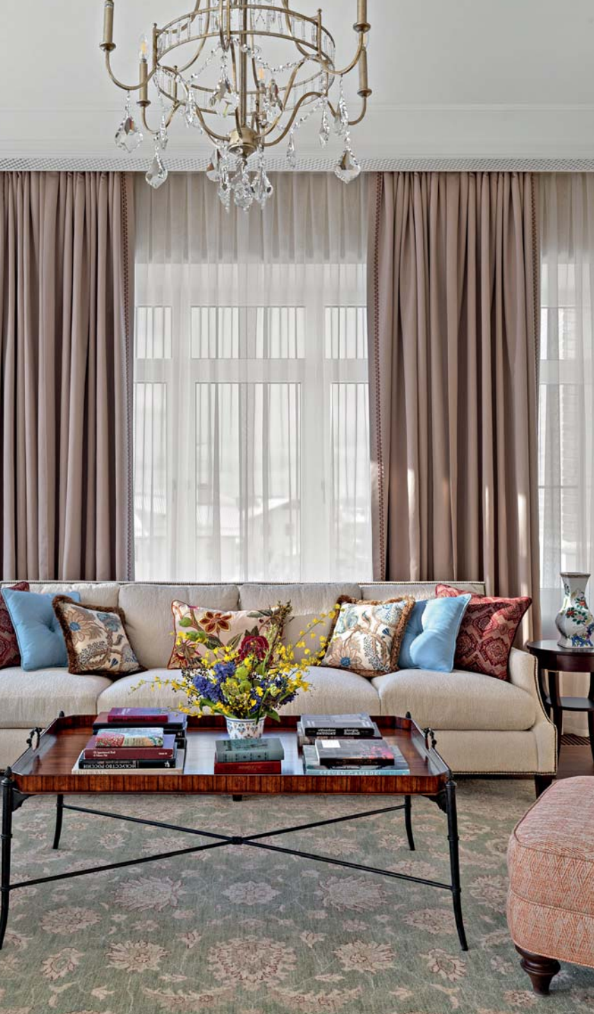
Зона отдыха в спальне. Диван, Bernhardt . Журнальный столик, Theodore Alexander . Ковер, Dovlet House . Придиванные столики, Ambella . Люстра, Wildwood Lamps