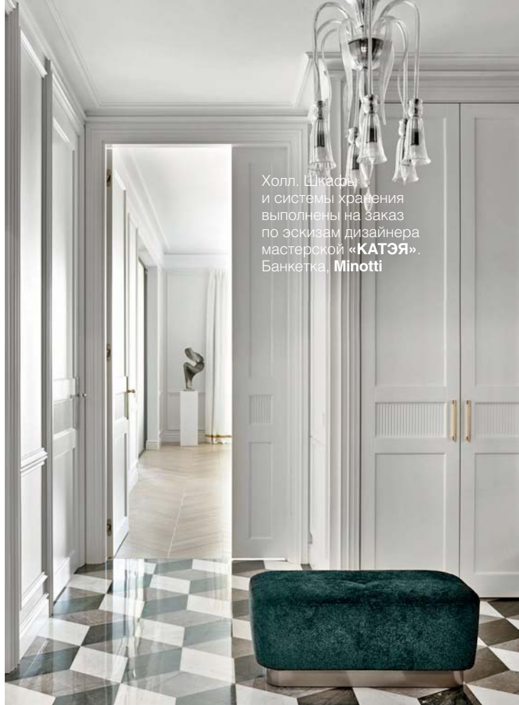
Холл. Шкафы и системы хранения выполнены на заказ по эскизам дизайнера мастерской «КАТЭЯ». Банкетка, Minotti