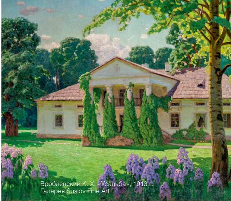
Вроблевский К. Х. «Усадьба», 1913 г. Галерея Suslov Fine Art